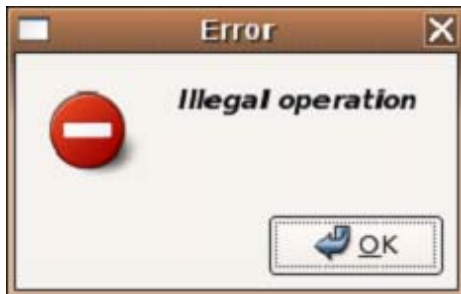
Figura 7 - Mensagem de erro

estoque com suas respectivas respostas. Aqui, demonstraremos dois exemplos usando a mesma classe GtkMessageDialog . A primeira exibindo uma mensagem de erro e a segunda perguntando por uma confirmação.