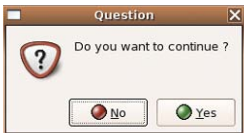
Figura 8 - Mensagem de confirmação

A seguir, temos um diálogo de confirmação para perguntar ao usuário final se o mesmo deseja continuar a operação. Veja que o terceiro parâmetro identifica o tipo de mensagem ( GTK::MESSAGE_QUESTION ) e o parâmetro seguinte identifica os botões que estarão presentes no diálogo ( GTK::BUTTONS_YES_NO ). A seguir, temos a mensagem a ser exibida. O diálogo será