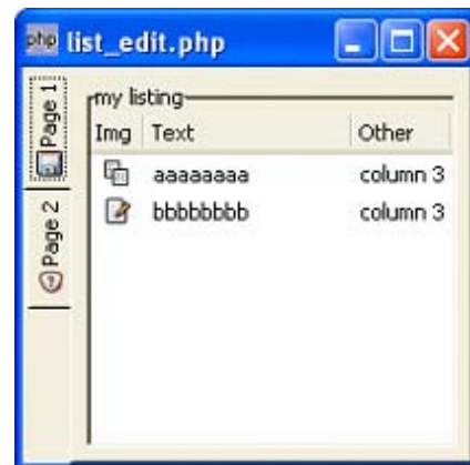
Figura 6 - Visual de uma janela no Windows