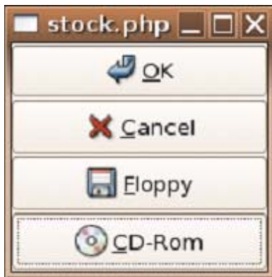
Figura 2 - Botões de estoque

<?php $window = new GtkWindow; $window->set_default_size(120,100); $vbox = new GtkVBox; # Cria botões de estoque $button = GtkButton::new_from_stock(Gtk::STOCK_OK); $vbox->pack_start($button); $button = GtkButton::new_from_stock(Gtk::STOCK_CANCEL); $vbox->pack_start($button); $button = GtkButton::new_from_stock(Gtk::STOCK_FLOPPY); $vbox->pack_start($button); $button = GtkButton::new_from_stock(Gtk::STOCK_CDROM); $vbox->pack_start($button); $window->add($vbox); $window->show_all(); gtk::main(); ?>