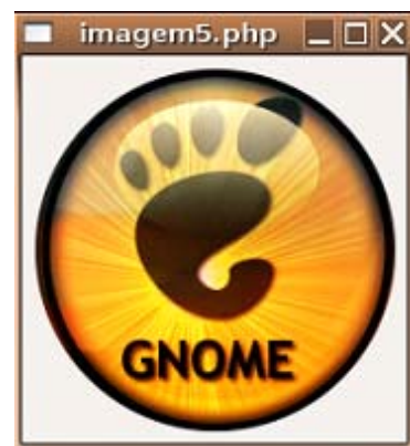
Figura 3 - Exibição de imagens

<?php # cria a janela $window = new GtkWindow; $window->set_default_size(200,200); # lê arquivo de imagem $imagem = GtkImage::new_from_file('gnome.png'); # adiciona à janela $window->add($imagem); # exibe $window->show_all(); gtk::main(); ?>