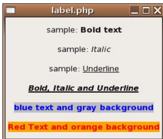
Figura 1 - Rótulos de texto com estilo

Quando desenvolvemos aplicações, é muito comum necessitarmos criar ícones com imagens como: salvar, abrir, fechar, deletar, adicionar, limpar, sair, sim, não, dentre outras. Quase todo tempo necessitamos disto. Para padronizar o visual de aplicações, o GTK2 oferece-nos itens de estoque, um conjunto de imagens comuns para se utilizar em aplicações para botões, menus, listagens, dentre outros. Usando imagens de estoque, não precisamos nos preocupar em procurar imagens na internet, pois a biblioteca já traz ícones para a maioria das tarefas