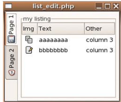
Figura 5 - Visual de uma janela no Ubuntu

<? Gtk::rc_parse('Wimp/gtk-2.0/gtkrc'); $window = new GtkWindow; $window->set_default_size(200,200); /* * Código da aplicação */ $window->show_all(); Gtk::main(); ?>